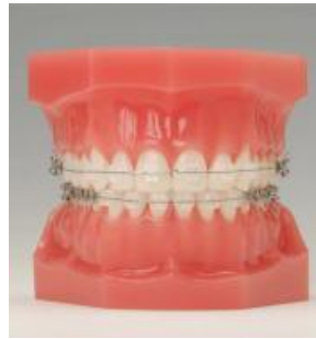
(白く見た目がきれいな装置)